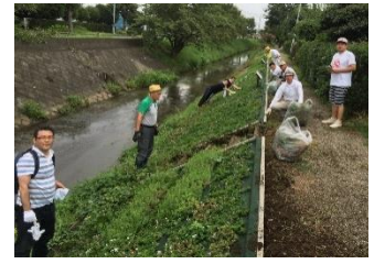
芝桜プロジェクト草刈り